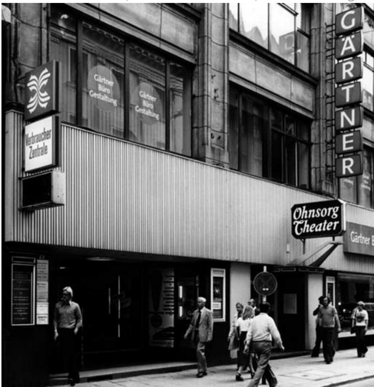
Nach der Sturmflut im Jahr 1962 beziehen die Verbraucherschützerinnen ihr neues Quartier in den Großen Bleichen. Es ist mit einer Fläche von 500 Quadratmetern zehnmal so groß wie das erste Büro.