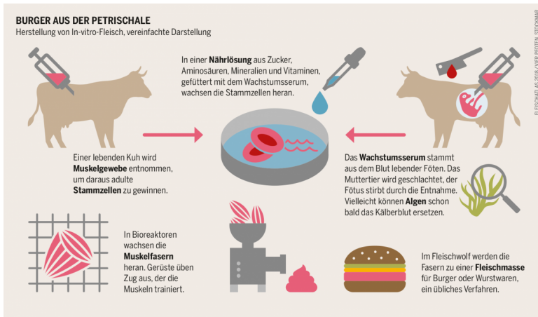
Abbildung: Bartz/Stockmar, Lizenz: CC-BY 4.0